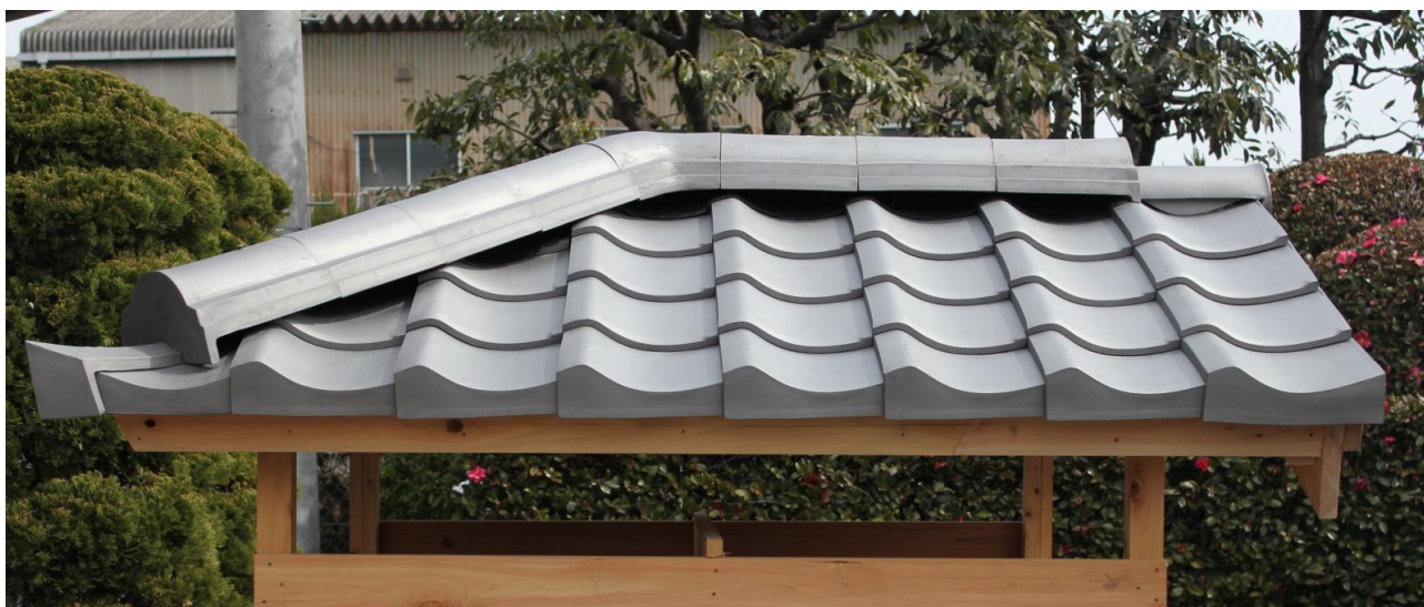
軒先：ストレート軒 袖：楽付防災袖 棟：耐震棟冠 新風

和形瓦の美しい伝統工法である「のし積み棟」に、強い地震や大きな台風等による被害が発生してしまうことがあります。既にガイドライン工法により、瓦屋根の安心・安全は確保されている中ですが、よりお客様に安心を提供させて頂くために、新しく 耐震棟冠 新風 を開発致しました。冠巾が8寸と広く、雨仕舞いにも安心感があり、厚のし2段にタモン丸を被せたデザインとする事で、ボリュームある和形の平場にも負けない、棟の高さを出しました。棟の軽量化、及び耐震・防災化に、是非ご利用下さい。